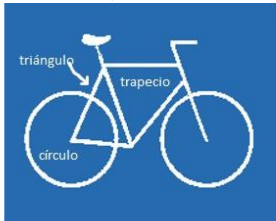
Pictograma de una bicicleta

Si dibujas un objeto, por ejemplo, en el caso de la bicicleta, las ruedas pueden ser una circunferencia, el manubrio una recta y el cuadro un triángulo.